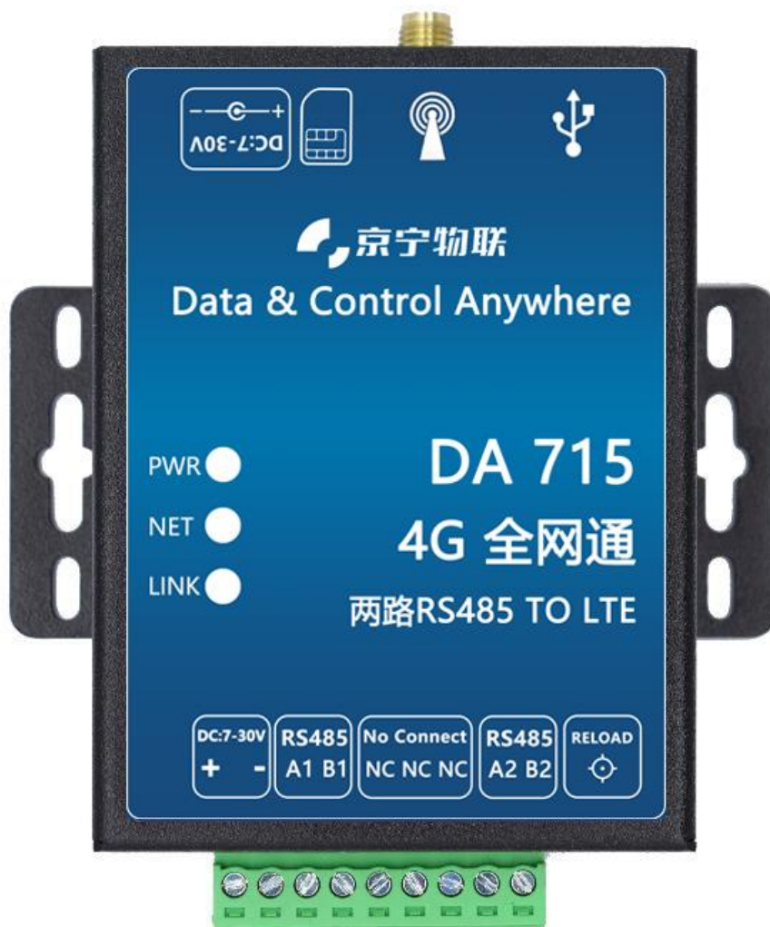
图 3 DTU 实物图