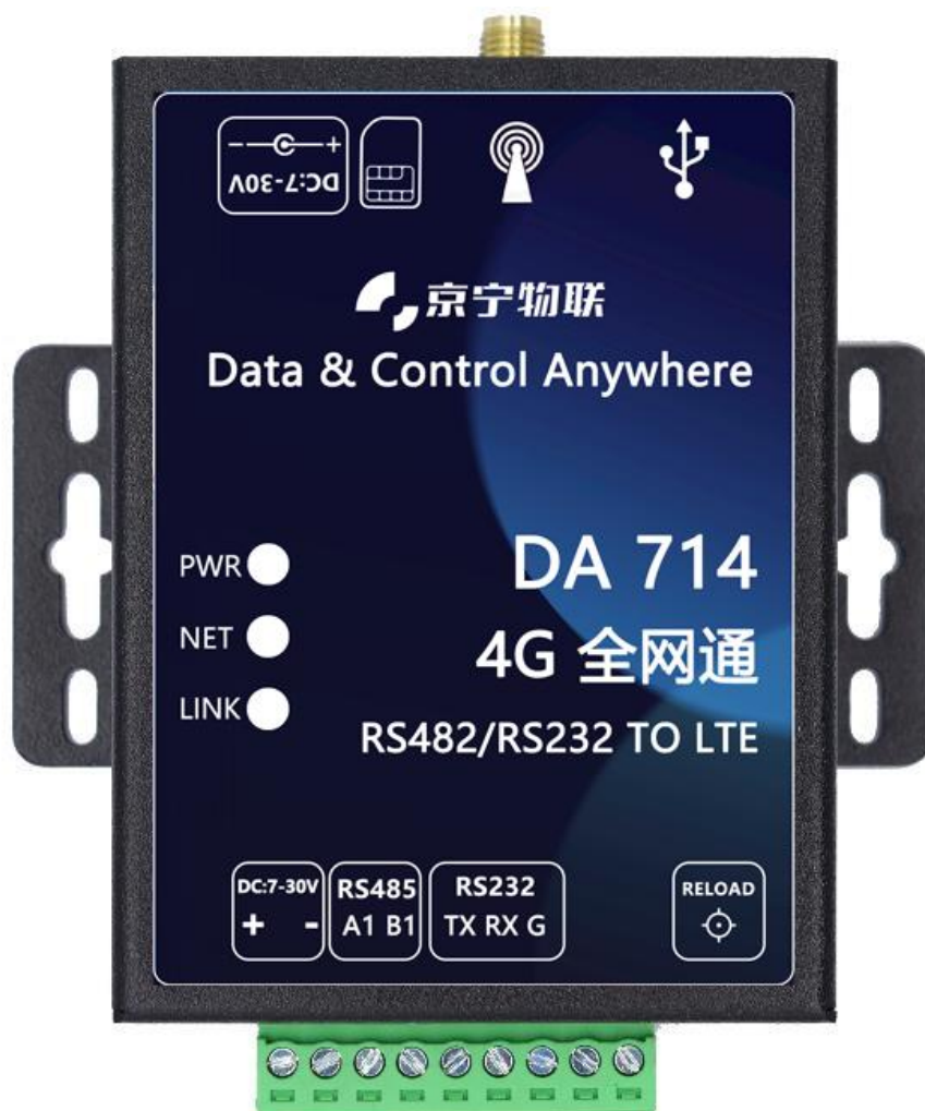
图 3 DTU 实物图