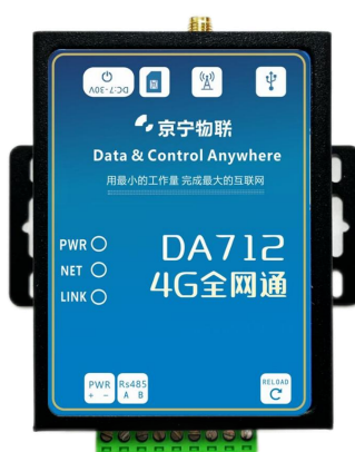
图 3 DTU 实物图